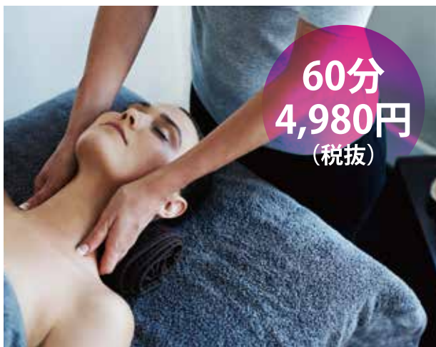
フェイシャルコース(デコルテ～顔)