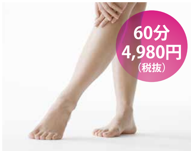
下半身集中コース (足裏～太もも)